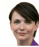
Kirsty Williams Democratiaid Rhyddfrydol Cymru Brycheiniog a Sir Faesyfed