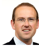
Llyr Huws Gruffydd Plaid Cymru Gogledd Cymru