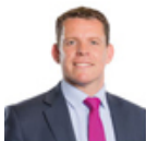
Rhun ap Iorwerth AM Plaid Cymru