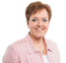
Dawn Bowden AM Welsh Labour