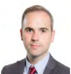
Steffan Lewis AC Plaid Cymru Dwyrain De Cymru