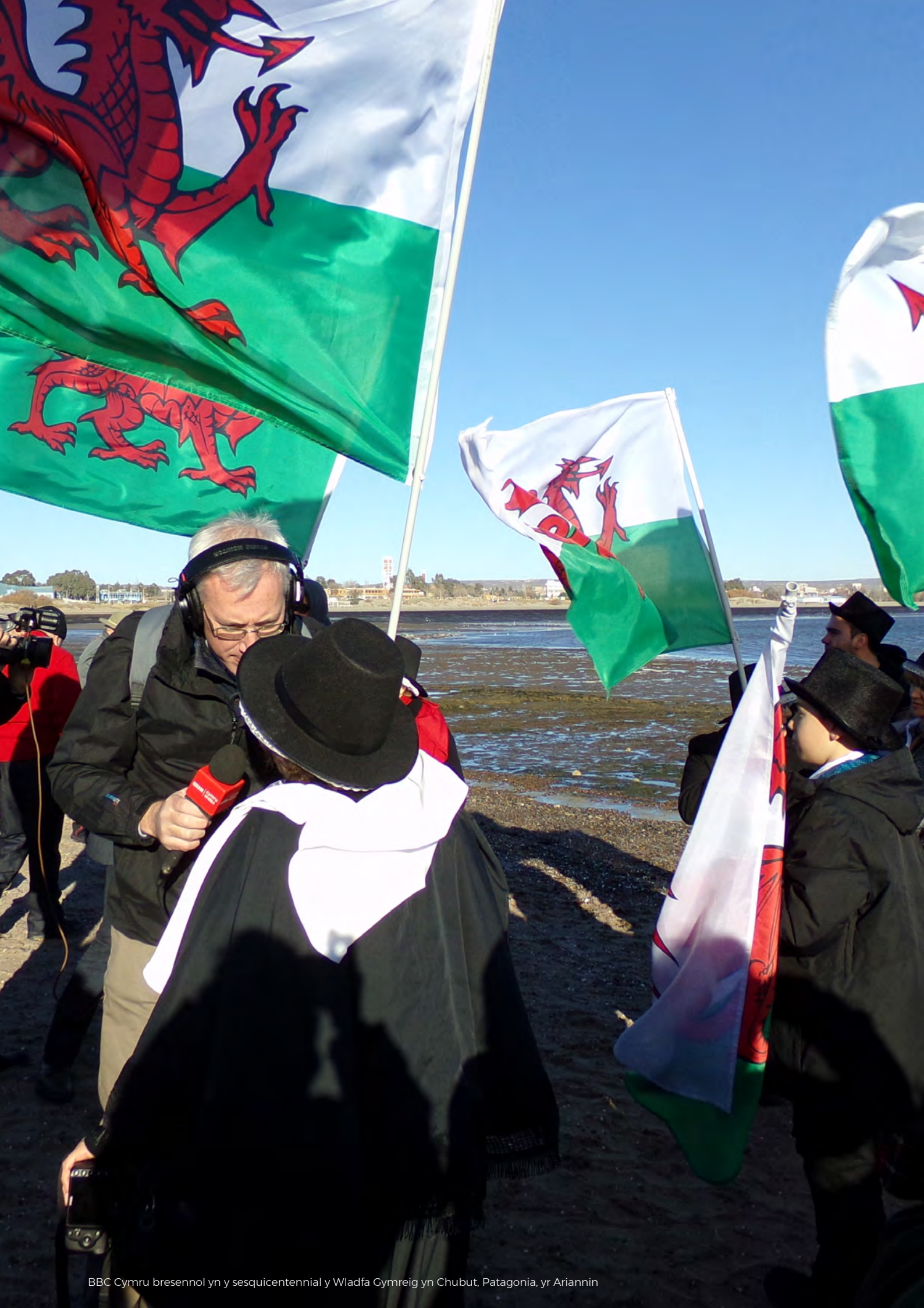
BBC Cymru bresennol yn y sesquicentennial y Wladfa Gymreig yn Chubut, Patagonia, yr Ariannin