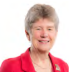
Jane Hutt AC Llafur Cymru Bro Morgannwg