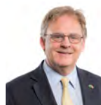
David Melding AC Ceidwadwyr Cymreig Gogledd Cymru