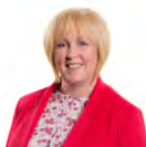
Suzy Davies AC Ceidwadwyr Cymreig Gornllewin De Cymru

Roedd yr Aelodau a ganlyn hefyd yn aelodau o'r Pwyllgor yn ystod yr ymchwiliad hwn: