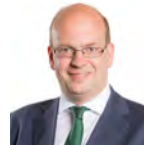
Mark Reckless AC Grŵp Ceidwadwyr Cymreig Dwyrain De Cymru