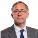
David Melding AC Ceidwadwyr Cymreig Canol De Cymru