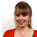
Delyth Jewell AC Plaid Cymru Dwyrain De Cymru